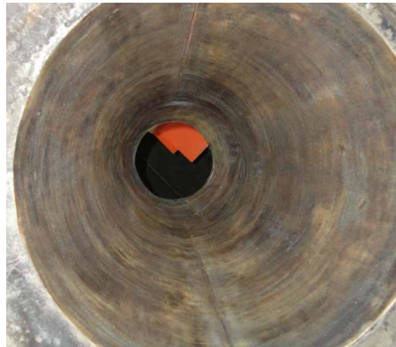
敷涂施工之前的钢锥体